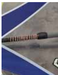
Reserveline på bommen