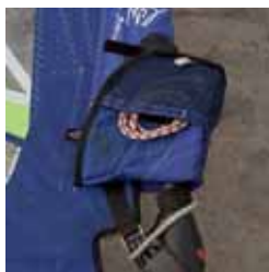
Reserveline i mastelommen

En reserveline, der kan surres fast på bommen, trapezkrogen eller gemmes i mastelommen kan blive nyttig i en kritisk situation. Linen kan f.eks. surre mast, sejl og bom sammen i tilfælde af havari, erstatte ødelagte liner og holde iturevne dele sammen, samt bruges som slæbeline. Det anbefales at medbringe mindst 5-6 meter line.